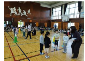
1年生を迎える会で2年生がメッセージカードをプレゼント

連休明けの5月は、おいしいレモネードがたくさんできるように教職員一丸となって力を尽くします。