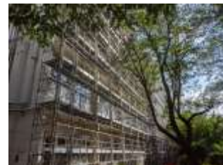
5年生はマナーよく仮設校舎から出入りしています。南校舎の周りはしばらく砂利道になります。気を付けてお通りください。

この2学期は、6年生の修学旅行、5年生の自然の教室をはじめとして、各学年の校外学習を実施することができません。子どもたちがどんなに楽しみにして、はりきって取り組もうとしていたかと思うと残念でなりません。でも子どもたちは、日々できることからしっかりと目標をもって取り組んでいこうとしています。子どもたちの学校生活は確実に進んでいきます。